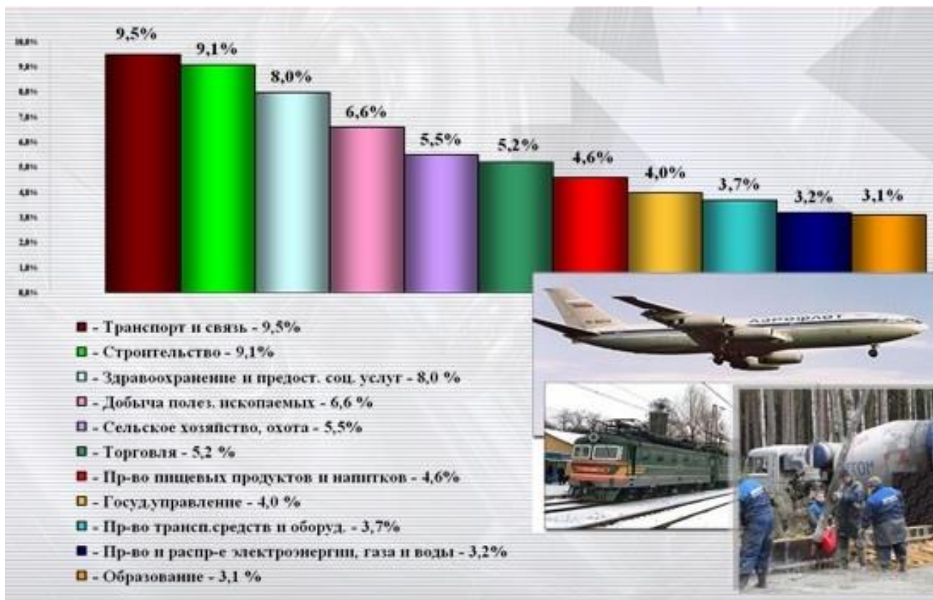
Рис. 1. Страховые случаи по основным видам экономической деятельности (2013 год)